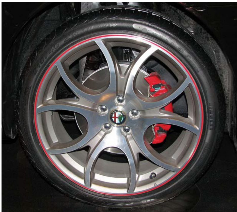
Serie speciale CNC, 17" 156080838, €428.70, Peso gr. 11000